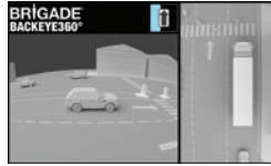
Gespiegelte Links-/Rechts-Ansicht und 360°-Ansicht mit Links/Rechts-Fokus