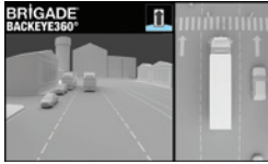
Gespiegelte Rückansicht und 360°-Ansicht