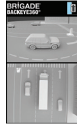
Gespiegelte Links-/Rechts-Ansicht und 360°-Ansicht

Eine Auswahl der 19 für den Bildschirm verfügbaren Anzeigeeoptionen