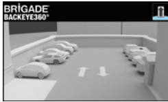
Vollständige gespiegelte Rückansicht